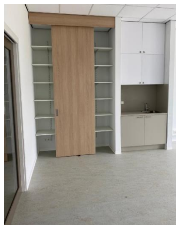
in elk lokaal aanrechtje met bergruimte voor methodisch materiaal, enz.