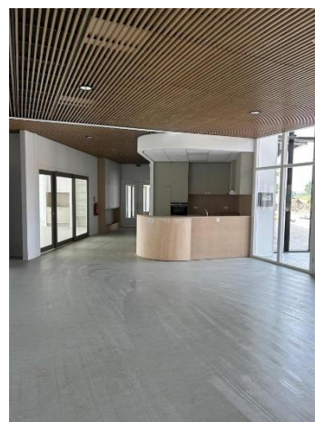
gedeelte van ontmoetingsruimte en keukentje