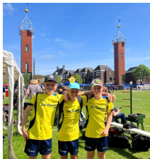
Zij mochten kaatsen op het Sjúkelân. Wat een eer!