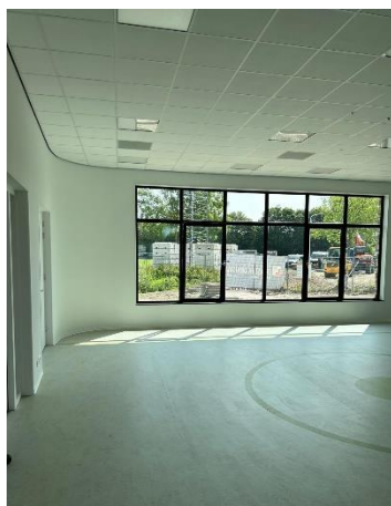
binnenzijde speellokaal/ ontmoetingsruimte