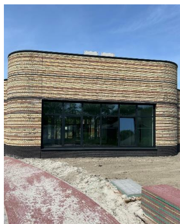
achteraanzicht speellokaal/ ontmoetingsruimte